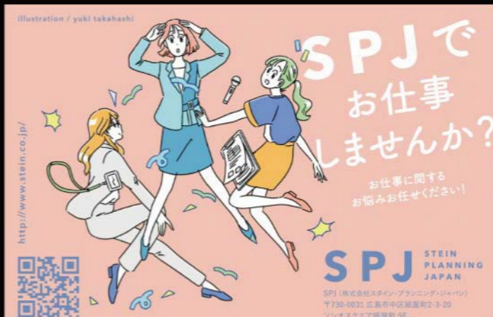
Illustration / yuki takahashi SPJ STEINER PLANNING JAPAN SPJ (株式会社スティーナ・プランニングジャパン) 〒730-0011 広島市中区紙屋町2-3-20 フシオスクエア5階 5F