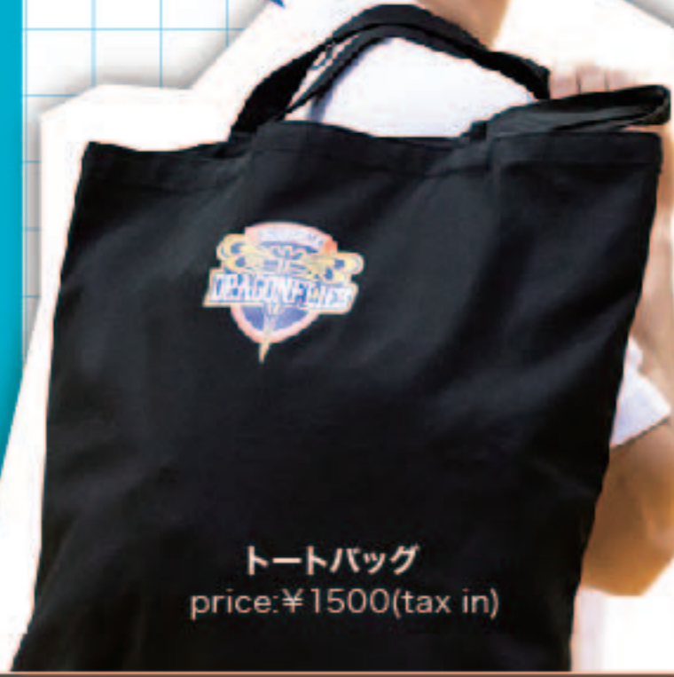
トートバッグ price: ¥1500 (tax in)