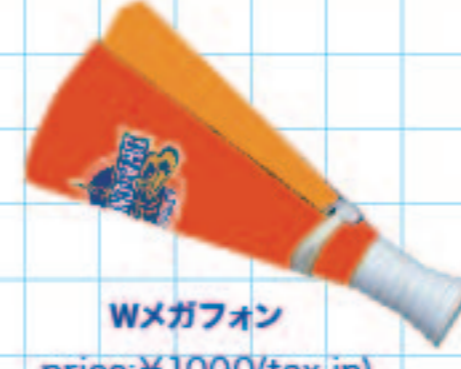
Wメガフォン price: ¥1000 (tax in)