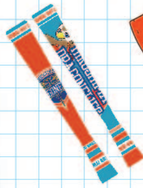
ツインメガフォン price: ¥1000 (tax in)