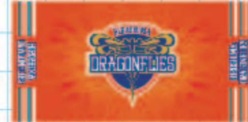
2020-21 ベンチタオル price: ¥5000 (tax in)