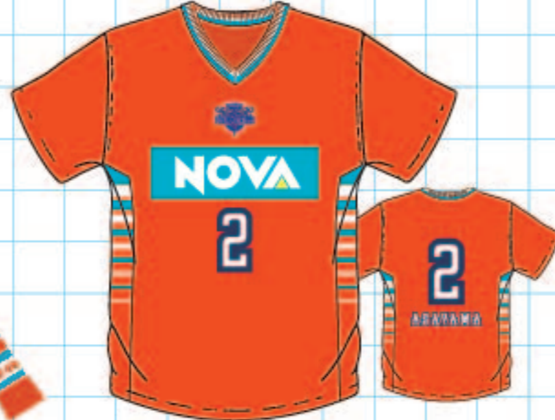
2020-21シーズン ユニフォームTシャツ/HOME price: ¥3000 (tax in) size: S / M / L / XL / 2XL (100 / 110 / 120 / 130 / 140 ※#2、#3、#5、#21、#24、#30のみ)