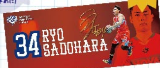
佐土原選手オリジナルタオル price: ¥2,500 (tax in)