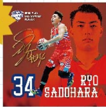
佐土原選手オリジナルステッカー price: ¥300 (tax in)